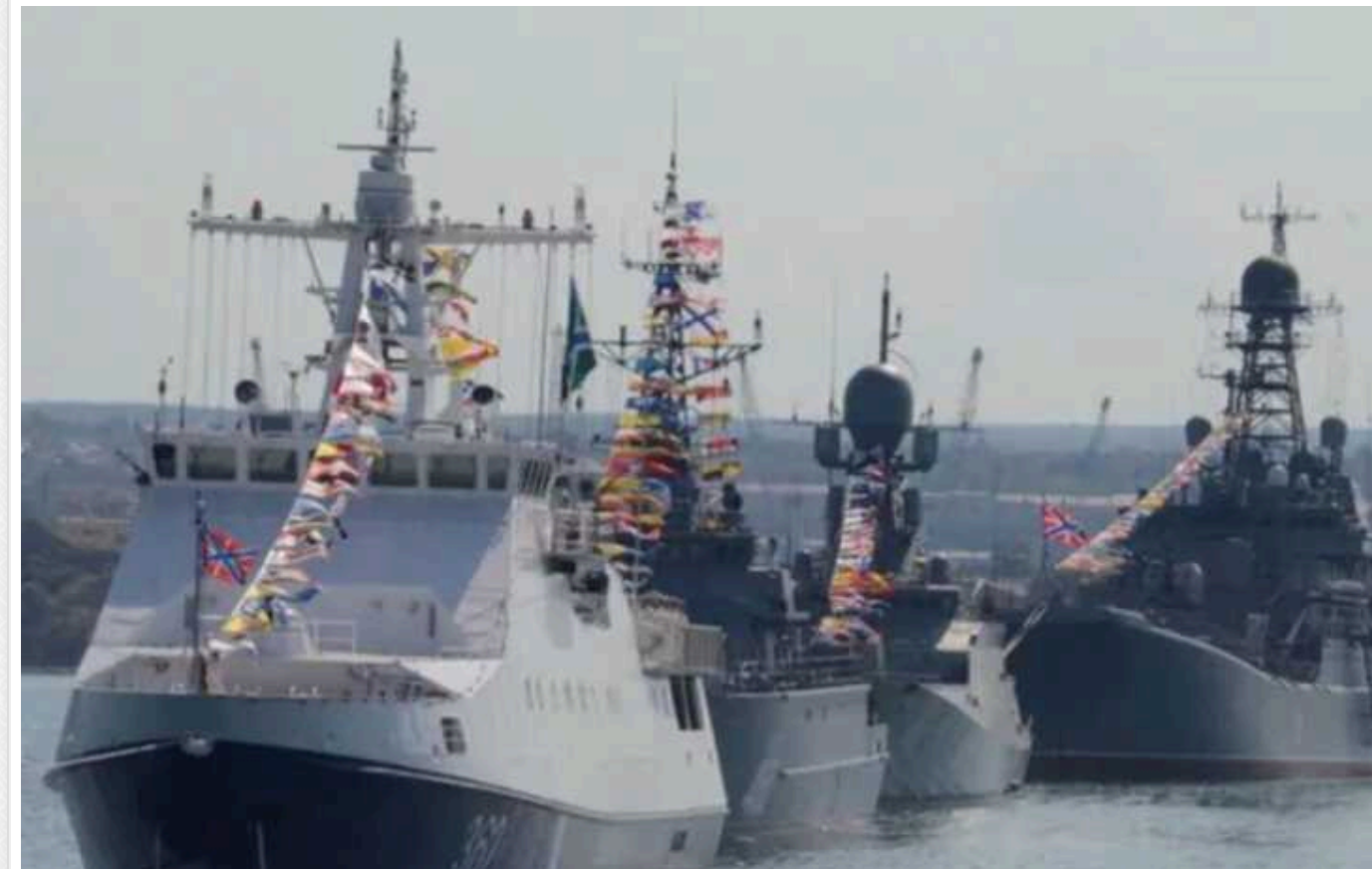
У Севастопольських бухтах зменшується кількість кораблів РФ, - OSINT-аналітик

З бухт тимчасово окупованого Росією Севастополя продовжують зникати кораблі Чорноморського флоту РФ. Судячи зі свіжих супутникових знімків, у Севастополі більше немає російської субмарини "Алроса", що зайшла у бухту окупованого міста минулого тижня.