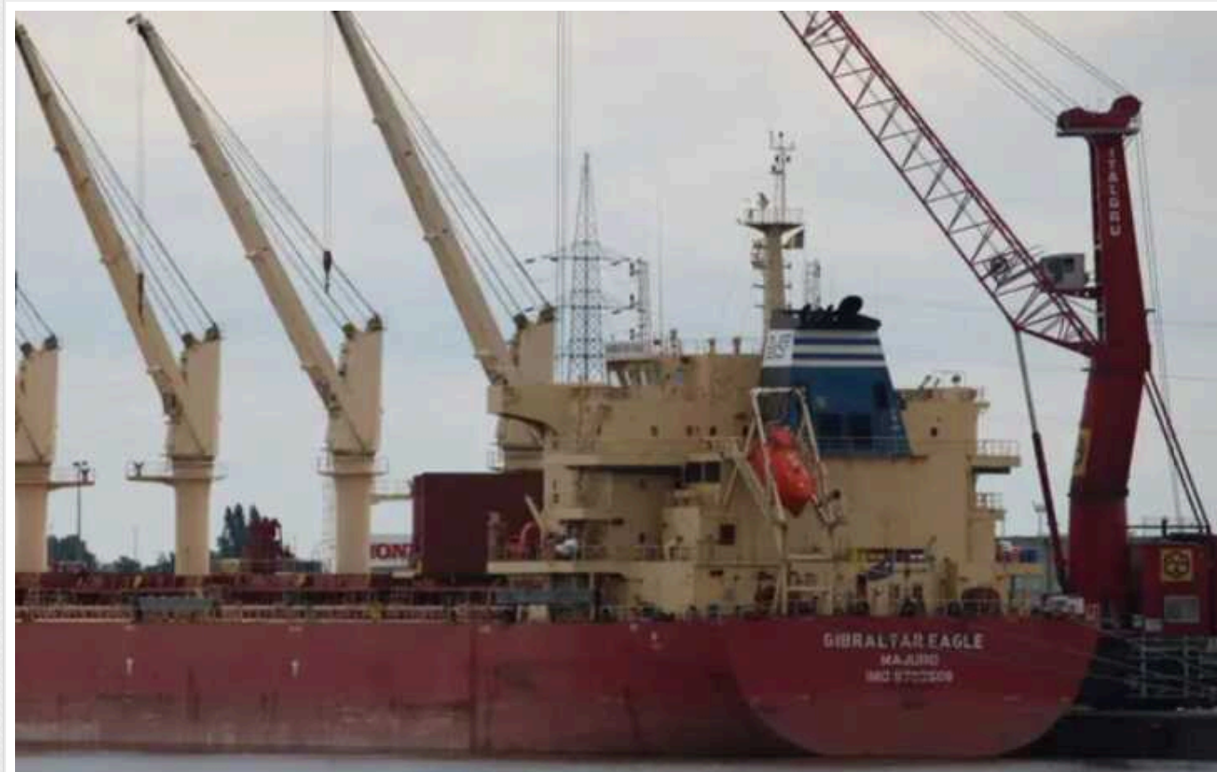
Держави Євросоюзу схвалили місію в Червоному морі для стримування хуситів – ЗМІ

Країни-члени Європейського Союзу підтримали створення військово-морської місії для захисту кораблів від атак підтримуваних Іраном повстанців-хуситів у Червоному морі. Однак Європейська служба зовнішніх дій (EEAS) відмовилася коментувати конфіденційні обговорення.