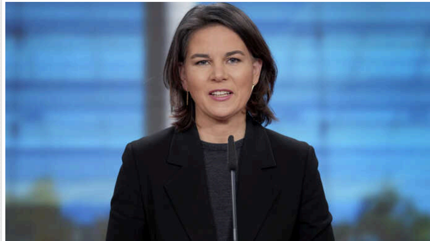
Бербок на форумі у Давосі пояснила, як конфлікт на Близькому Сході впливає на війну в Україні

Конфлікт Ізраїлю та Палестини не тільки загрожує поширенням на найближчі території, а й впливає на Європу, зокрема та війну в Україні. Тому обов'язок міжнародної спільноти знайти вихід із цієї ситуації.