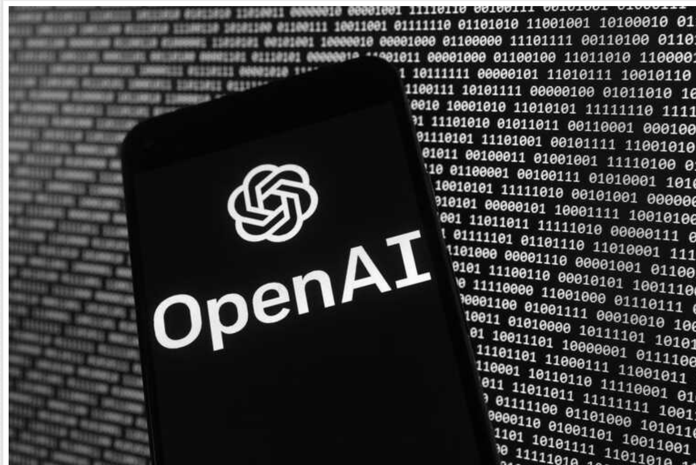
OpenAI має намір боротися з дезінформацією, що генерується ШІ для політичних цілей

Провідний розробник штучного інтелекту OpenAI заборонив своїм клієнтам використовувати його інструменти (ChatGPT, Dall-e) у політичних цілях.