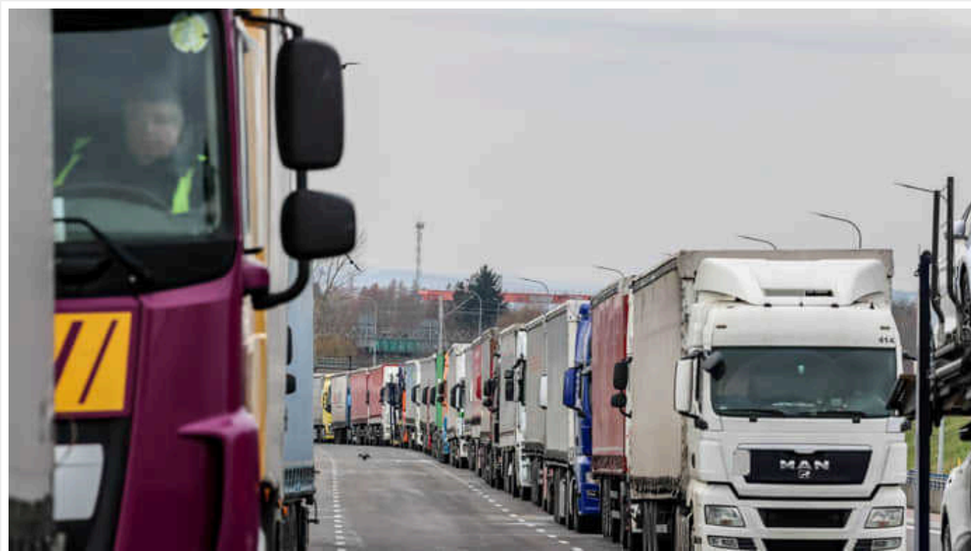
Уряд Польщі підписав угоду з перевізниками, які блокують кордон з Україною, - міністр інфраструктури Даріуш Клімчак