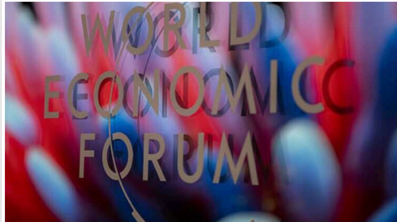
На форумі в Давосі назвали глобальні ризики: ШІ зажене у бідність, клімат погіршиться, війн стане більше