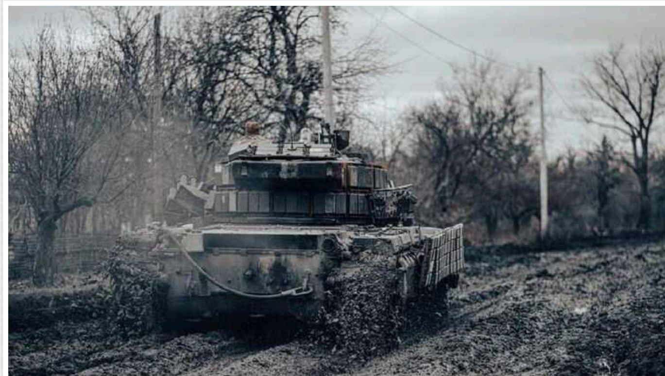
ЄС розпочав перевірку постачання зброї європейськими країнами України - FT

Європейський Союз розпочав перевірку постачання зброї до України європейськими країнами з початку вторгнення Росії.