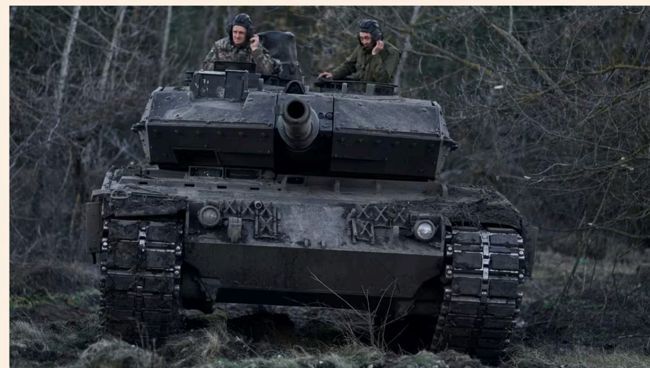
Concern is mounting that willingness to help Ukraine is ebbing after two years of war

Assessment follows complaints that some countries are failing to send as many weapons as they could