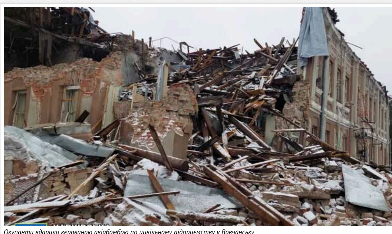
Окупанти вдарили керованою авіабомбою по цивільному підприємству у Вовчанську

Учора ввечері російські військові вдарили авіабомбою по цивільному підприємству у Вовчанську Харківської області. Будівля повністю зруйнована.