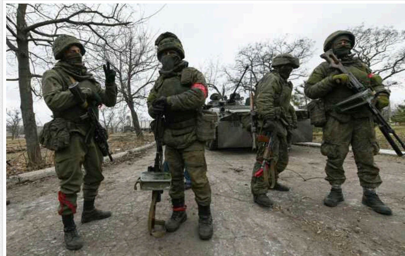
Групи зрадників, які воювали на стороні окупантів, загрожує довічне ув'язнення

Правоохоронці направили до суду справу стосовно дев'яти окупантів, які воювали на Донбасі. Їм загрожує довічне ув'язнення за держзраду.