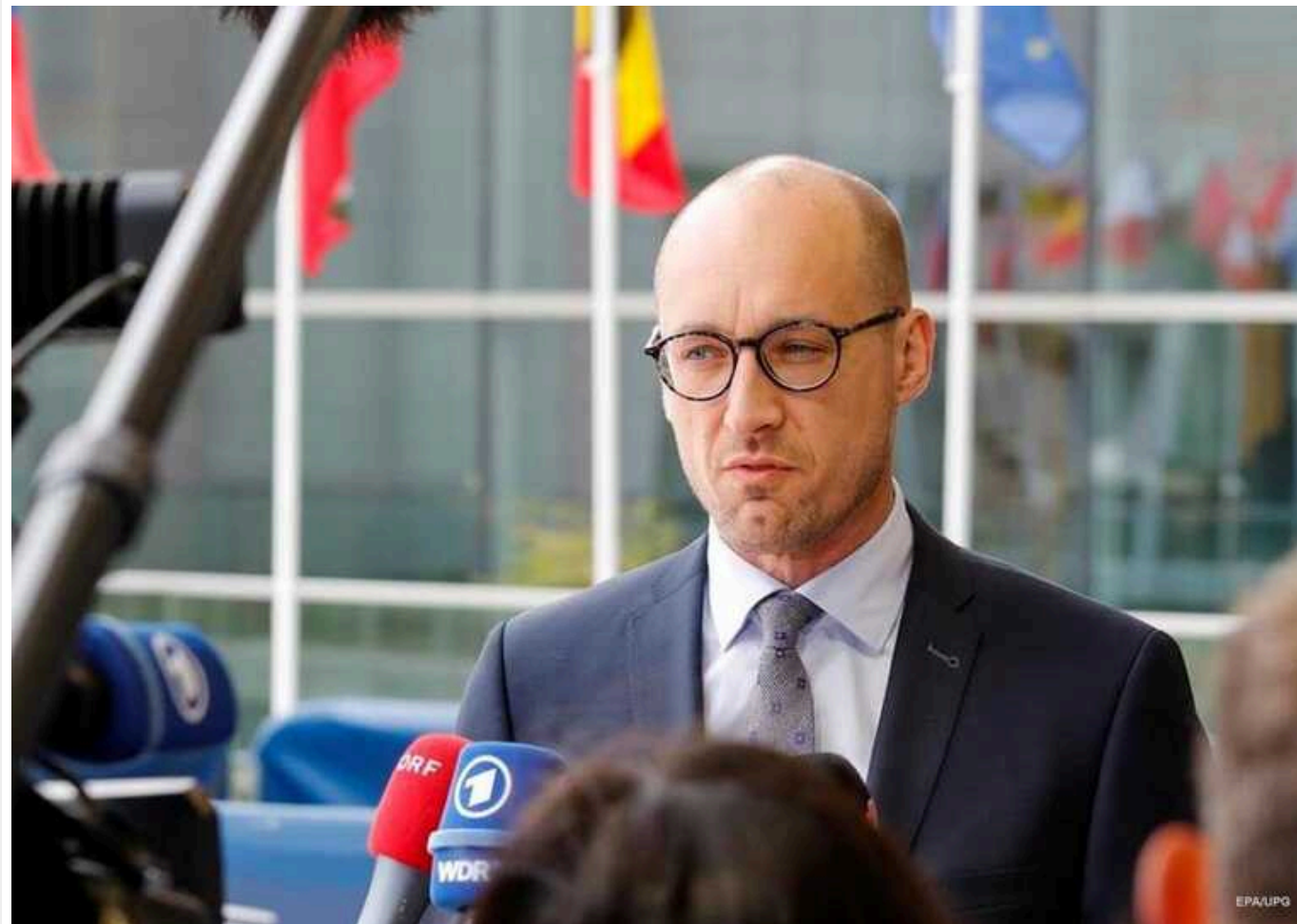
ЄС почав працювати над пропозиціями щодо заморожених російських активів в інтересах України

Європейський Союз почав технічні роботи по реалізації пропозицій щодо використання заморожених російських активів в інтересах України.