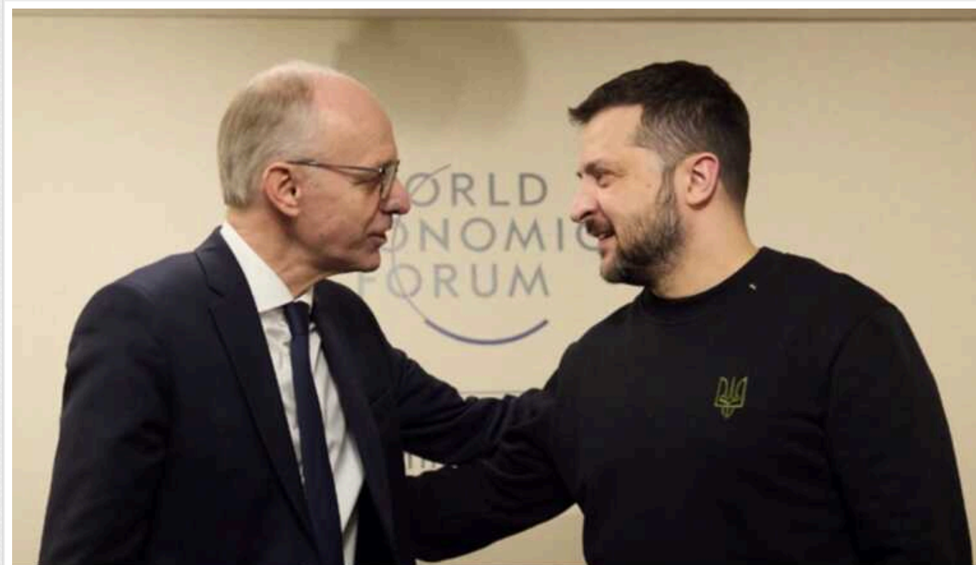
Зеленський зустрівся з прем'єром Люксембургу: обговорили фінансову підтримку та конфіскацію російських активів

Президент Володимир Зеленський і прем'єр-міністр Великого Герцогства Люксембург Люк Фріден обговорили продовження співпраці, зокрема фінансову підтримку України та конфіскацію заморожених активів Росії.