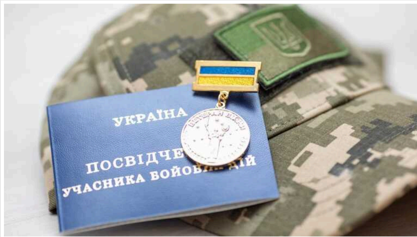
У ВР підтримали законопроект про автоматичне отримання УБД і створення єдиного е-реєстру військовозобов'язаних (Доповнено)

Народні депутати підтримали законопроект про автоматичне набуття статусу учасника бойових дій та створення єдиного електронного реєстру військовозобов'язаних.