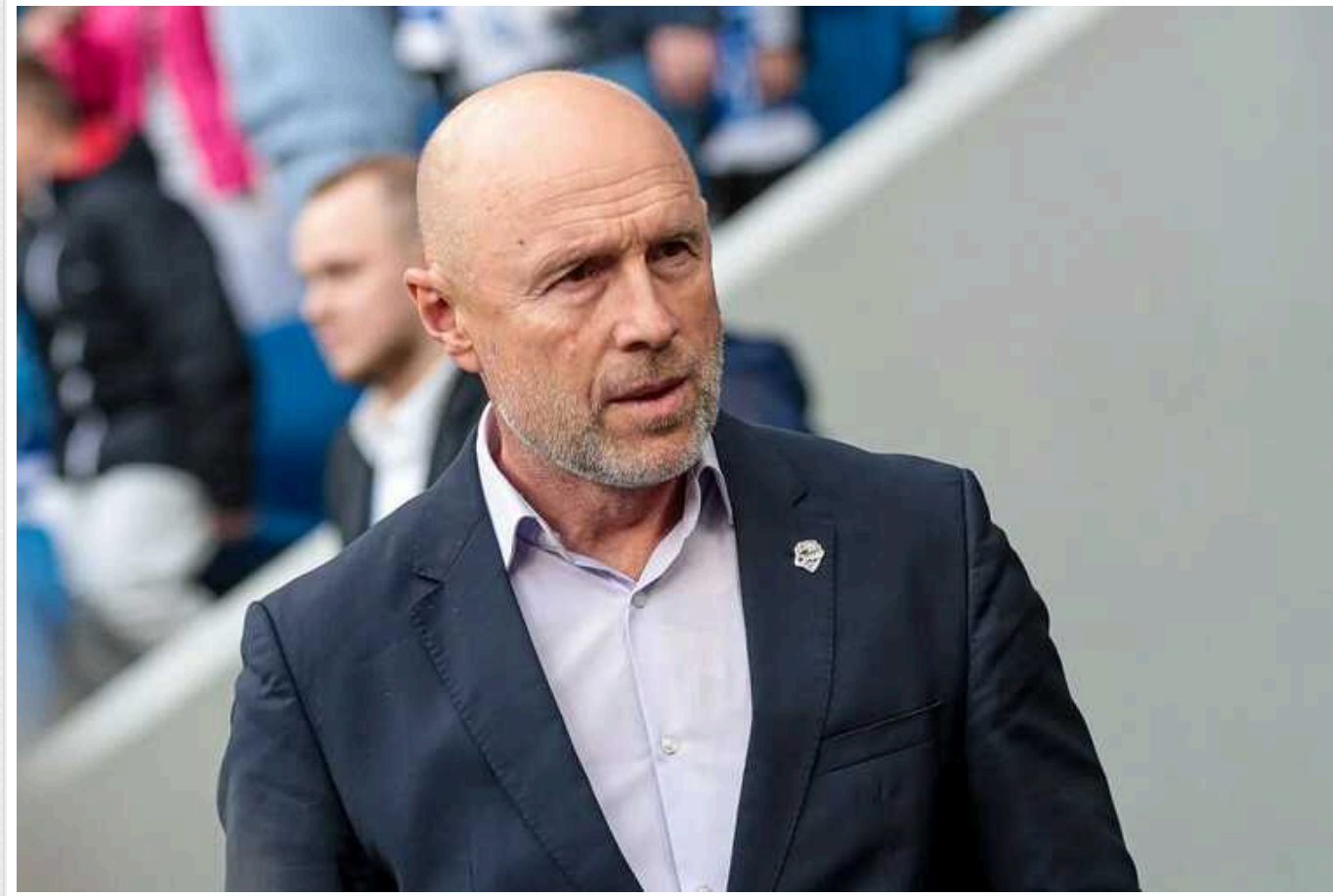
У РФ поскаржилися на ФІФА та УЄФА, згадавши про "українських активістів": "Не готові на компромісі"

Міжнародна федерація футболу (ФІФА) та Європейський футбольний союз (УЄФА) не готові вдатися до пом'якшення санкцій щодо Росії. При цьому представники країни-агресорки продовжують наполягати, що їхнє відсторонення від змагань несправедливе та нібито політизоване.