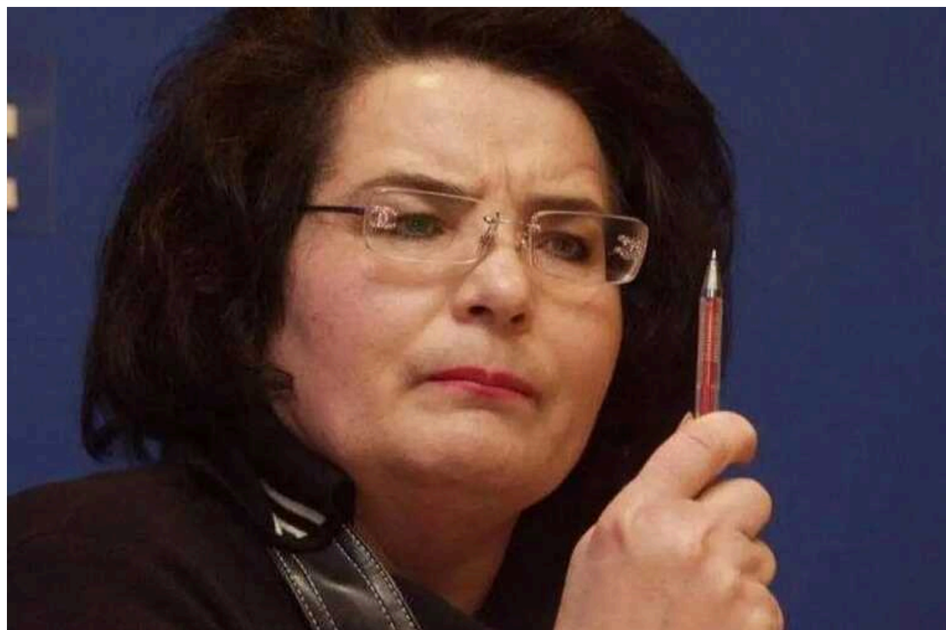
Ручна прокурорка Кучми після смерті два місяці пролежала у квартирі: як самотність стала розплатою за гріхи

Колішня заступниця генпрокурора та вірна соратниця Леоніда Кучми Ольга Колінько померла на самоті після тривалої хвороби, мертва жінка два місяці пролежала у квартирі. Її тіло знайшли зі значними ознаками гноїння лише після комунальної аварії: на сусідів знизу полилась вода. Колісь гроза опонентів Кучми прожила всього 71 рік. Її єдина донька, яку вона виховала без чоловіка, померла через кілька тижнів після мамі. І теж зачичненою у власній квартирі.