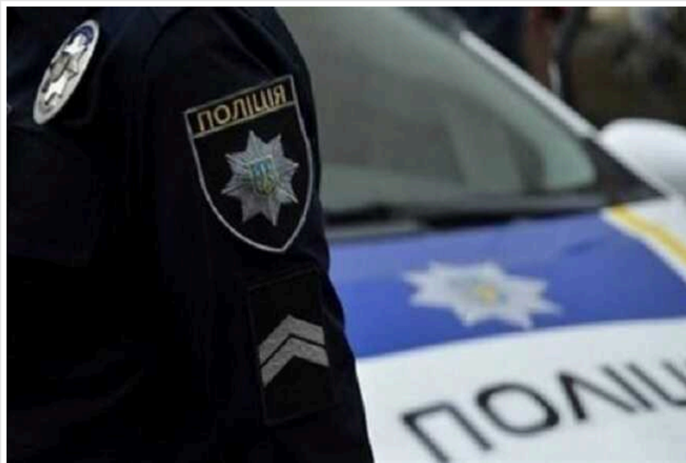
У Києві в чоловіка у квартирі знайшли арсенал зброї та наркотики в банках: гранати зберігав на підвіконні

У Києві викрили чоловіка, який зберігав удома боєприпаси та наркотики. Зокрема, на підвіконні в нього знайшли гранати, а у кімнатах – міни.