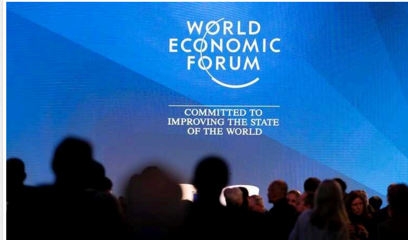
Доповідь форуму в Давосі: Війна в Україні може тривати роки, змінюючись загостреннями та заморожуванням

Війна в Україні протягом найближчих двох років "може періодично змінюватися то загостреннями, то заморожуванням", йдеться у доповіді форуму в Давосі щодо оцінки глобальних ризиків на 2024 рік.