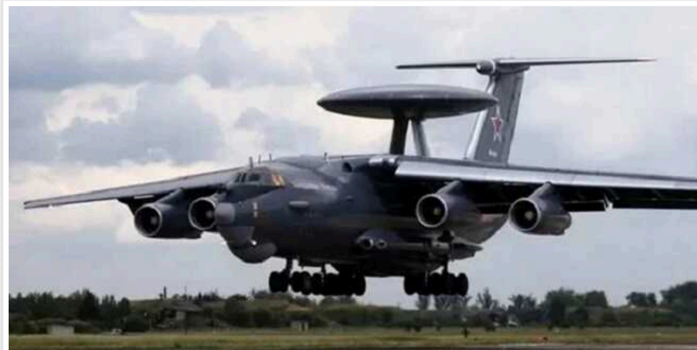
Буданов сказав, як втрата літака ДРЛВ може вплинути на авіацію ворога: у РФ залишилося 8 справних А-50

Начальник Головного управління розвідки Міністерства оборони України Кирило Буданов повідомив, що після знищення ЗСУ над Азовським морем російського А-50 у Росії залишилося зовсім небагато таких літаків ДРЛВ (далекого радіолокаційного виявлення та управління). Лише вісім із них зараз у хорошому стані.