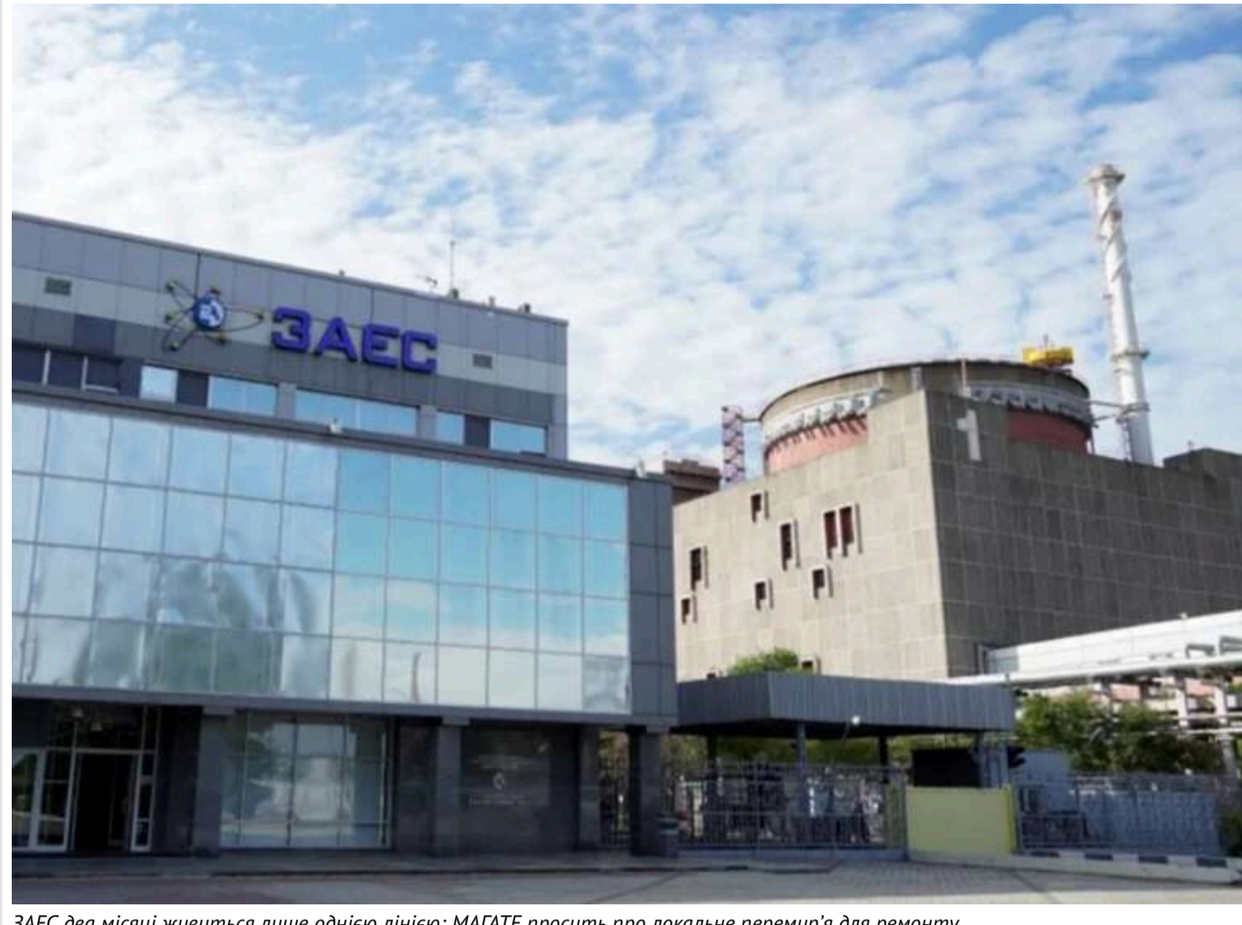
ЗАЕС два місяці живиться лише однією лінією: МАГАТЕ просить про локальне перемир'я для ремонту

Тимчасово окупована Запорізька АЕС протягом двох місяців досі залежить від однієї лінії зовнішнього електропостачання. З цього приводу МАГАТЕ проводить переговори з Україною та Росією запровадити локальне припинення вогню для проведення ремонтних робіт.