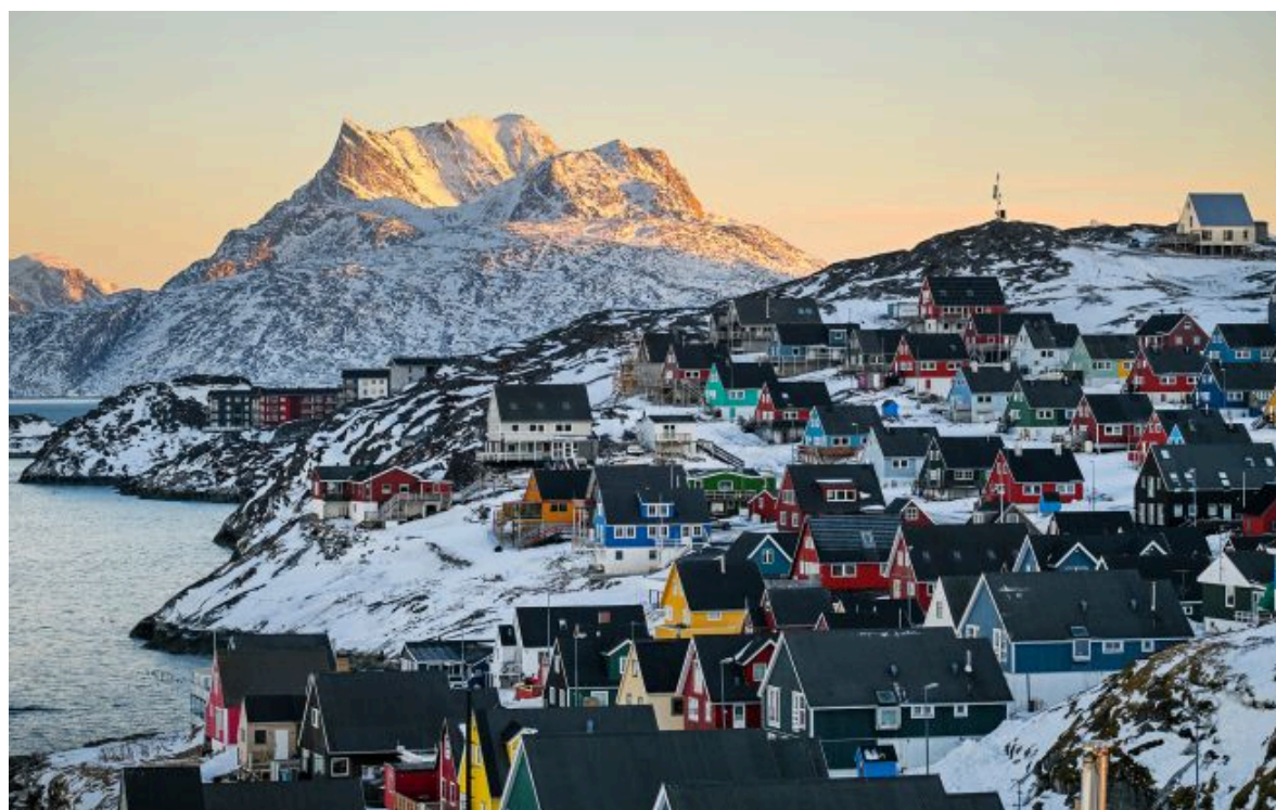
Фото: Гренландія може знизити ціни на нафту під час війни з Іраном