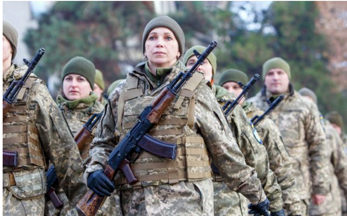
Фото: нова пропаганда від Росії щодо мобілізації в Україні