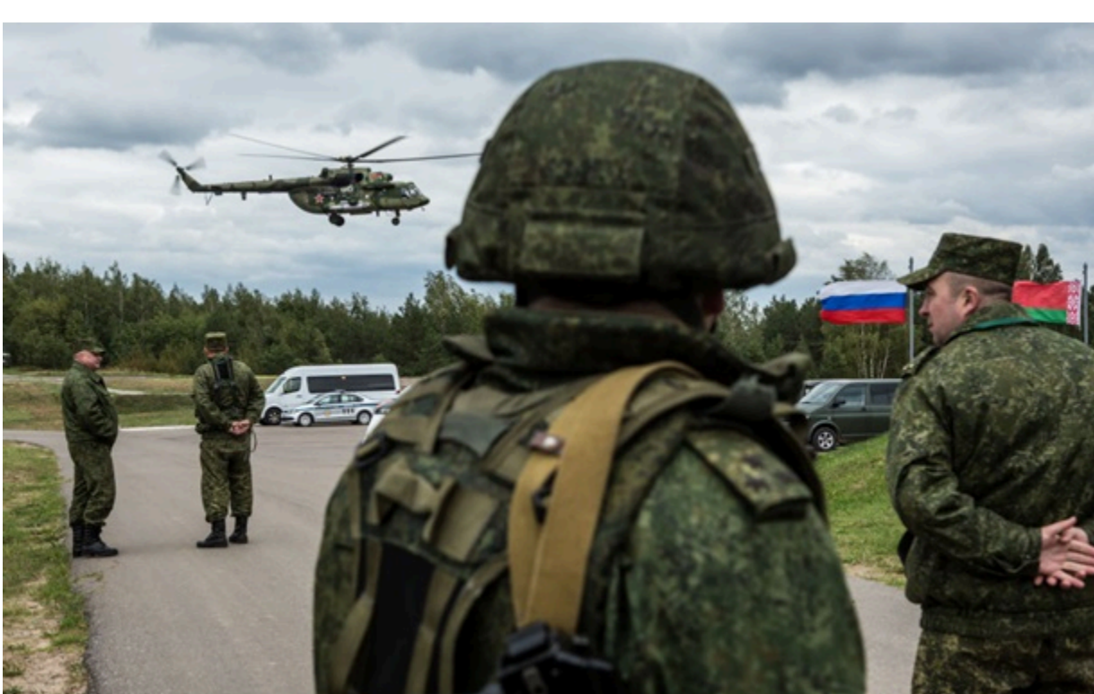
Зеленський також попереджає про загрозу наступу з Білорусі

Північний напрямок зберігається у планах російського Генерального штабу як один із варіантів розширення фронту.