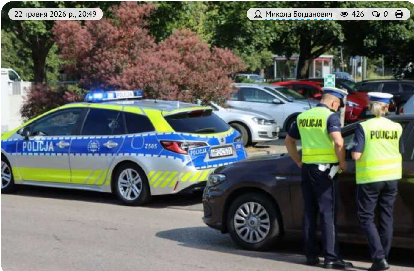
У польському Радомі побили та пограбували українця

У центрі польського Радомі четверо чоловіків жорстоко побили молодого громадянина України. Жертва отримала травми - вибитий плечовий суглоб і травми голови. Випадок виділяється відвертою етнічною мотивацією - нападники вимагали від жертви співати польську пісню, а тоді напала через акцент.