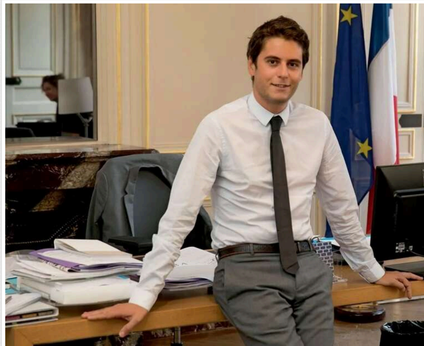
Експрем'єр Франції Габріель Атталь оголосив про участь у президентських виборах 2027 року

Колишній прем'єр-міністр Франції та лідер партії "Відродження" Габріель Атталь оголосив про свої наміри балотуватися на виборах президента 2027 року.