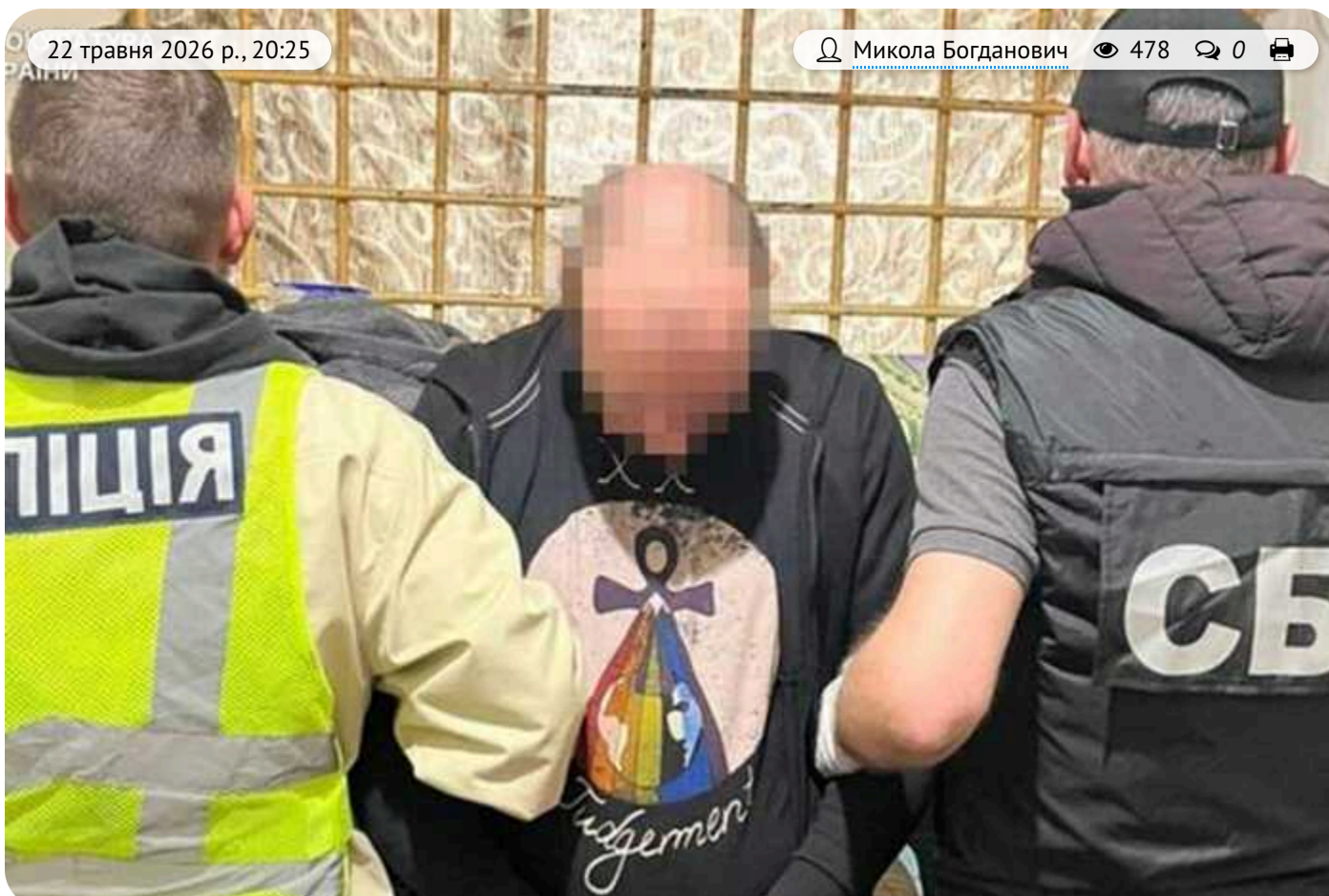
Керував бізнесом просто з камери: у Львові в'язень СІЗО налагодив дистанційний продаж штурмової зброї

На Львівщині правоохоронці викрили схему продажу зброї та вибухівки. Схему організував 45-річний львів'янин, який перебуває в колонії.