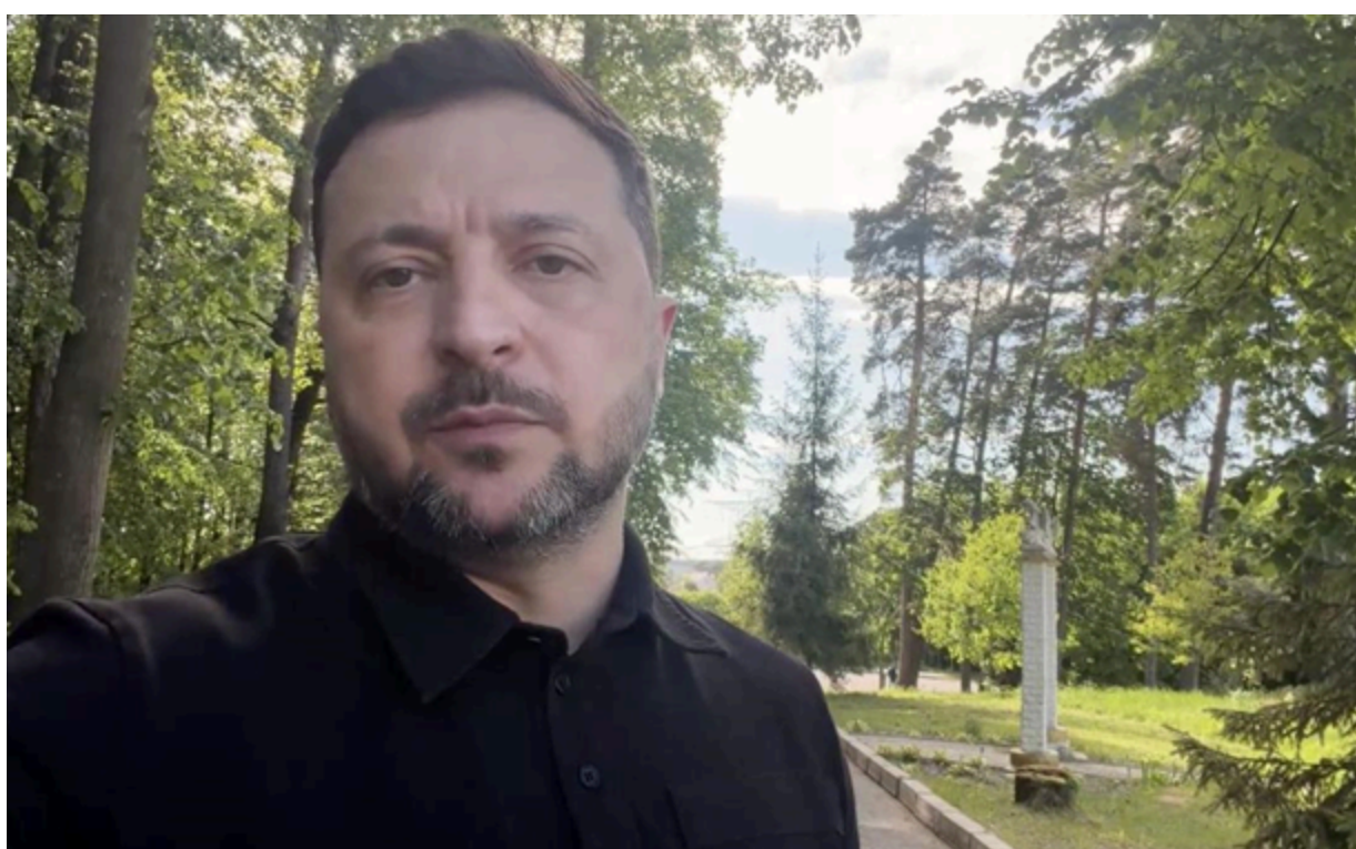
Зеленський прокоментував успіхи ЗСУ на фронті

Українські позиції на даний момент стали більш стійкими і сильними, ніж у попередні роки, наголосив президент.