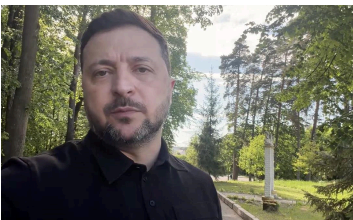
Зеленський прокоментував успіхи ЗСУ на фронті

Українські позиції на даний момент стали більш стійкими і сильними, ніж у попередні роки, наголосив президент.