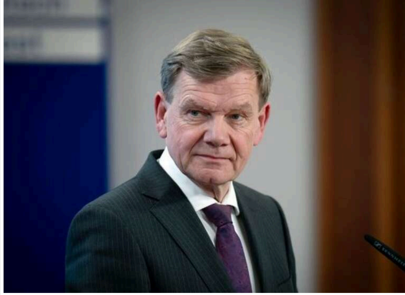
Німеччина пропонує новий механізм фінансування допомоги Україні через оборонну співпрацю з НАТО

Міністр закордонних справ Німеччини Йоганн Вадефуль має намір запропонувати новий механізм фінансової допомоги Україні на зустрічі зі своїми колегами з країн НАТО в Гельсінгборзі.