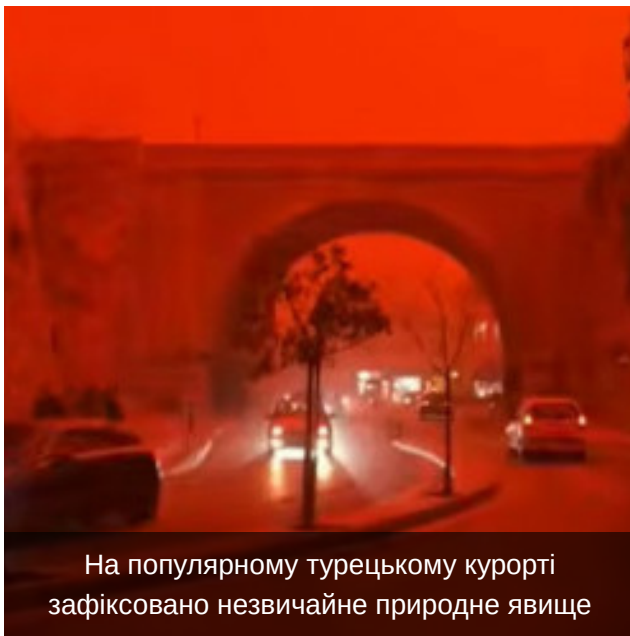
Фото та Відео

На популярному турецькому курорті зафіксовано незвичайне природне явище