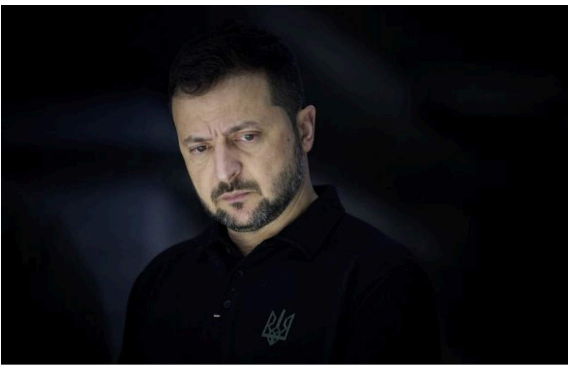
Фото: Володимира Зеленський