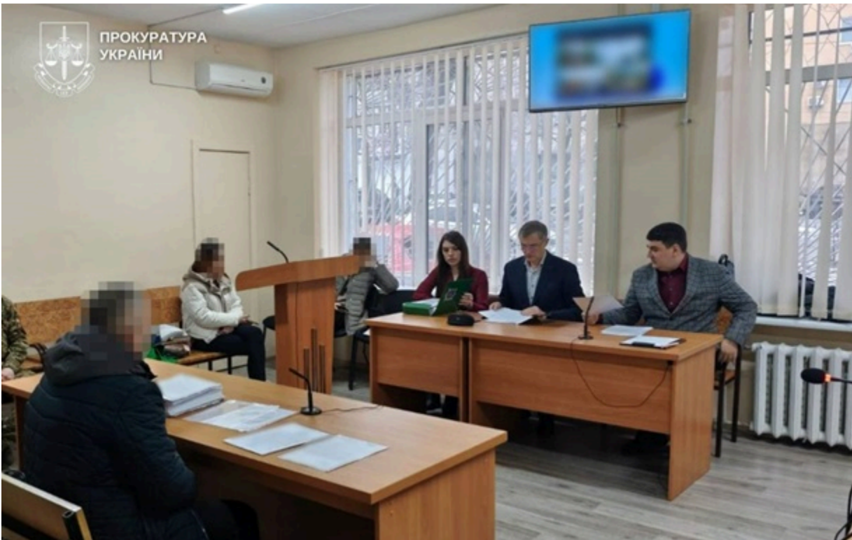
Прокуратура забезпечила максимальне покарання за санкцією статті

Прокурори домоглися підтвердження вироків засудженим до 12 років позбавлення волі за зґвалтування неповнолітніх дівчат.