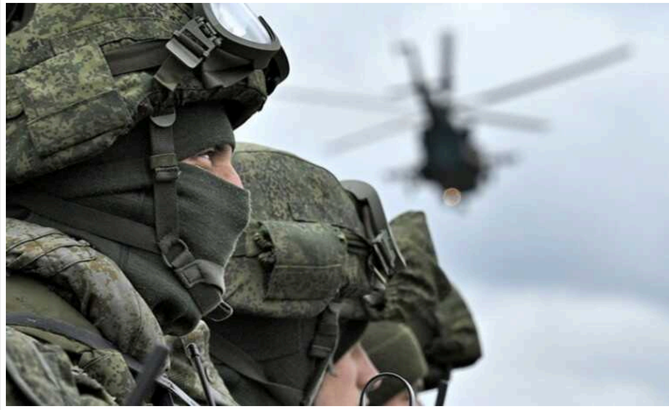
Британська розвідка назвала головну мету російської армії на фронті: хочуть оточити Авдіївку

За останній тиждень ні російські, ні українські сили не досягли якихось значних успіхів. Головною метою російської армії є оточення Авдіївки.