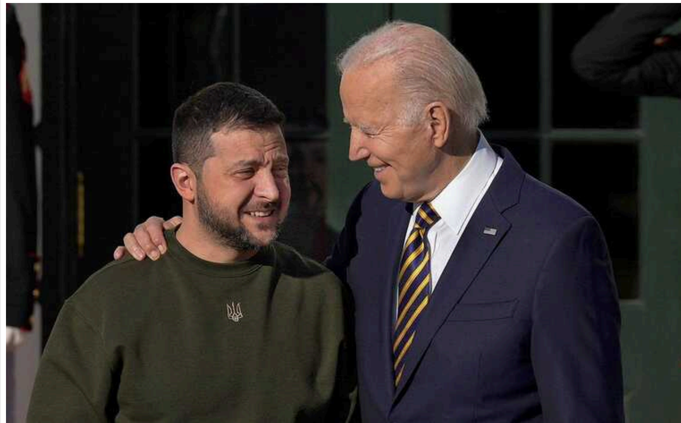
У Давосі Зеленський отримає послання від Байдена щодо стратегії у війні з РФ, – Bloomberg

Радник Білого дому з питань національної безпеки Джейк Салліван під час розмови з Президентом України Володимиром Зеленським на полях Всесвітнього економічного форуму в Давосі передасть послання від американського лідера Джо Байдена щодо війни з Росією.