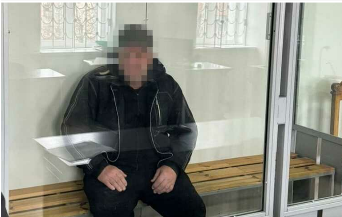
СБУ затримала охоронця дитсадка на Запоріжжі: наводив ракети РФ на будинки мирних мешканців