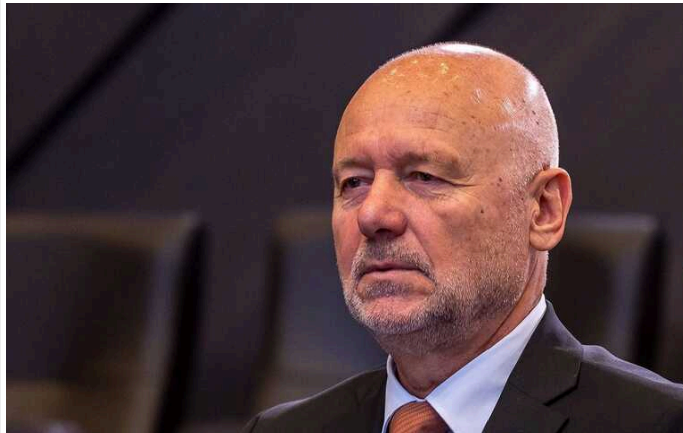
Міністр оборони Болгарії: Основна частина виробництва болгарського ВПК йде в Україну

Військово-промисловий комплекс Болгарії працює 24 години 7 днів на добу, і основна частина виробництва йде в Україну. Передача зброї та боеприпасів відбувається напругу або через третіх осіб.