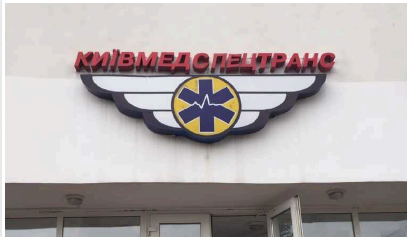
Фісталь через суд змусив медиків Києва укласти договір щодо «швидких» через е-каталог

КО «Київмедспецтранс» 14 грудня замовила ТОВ «Автоспецпром» автомобілів швидкої медичної допомоги на 80,80 млн грн.