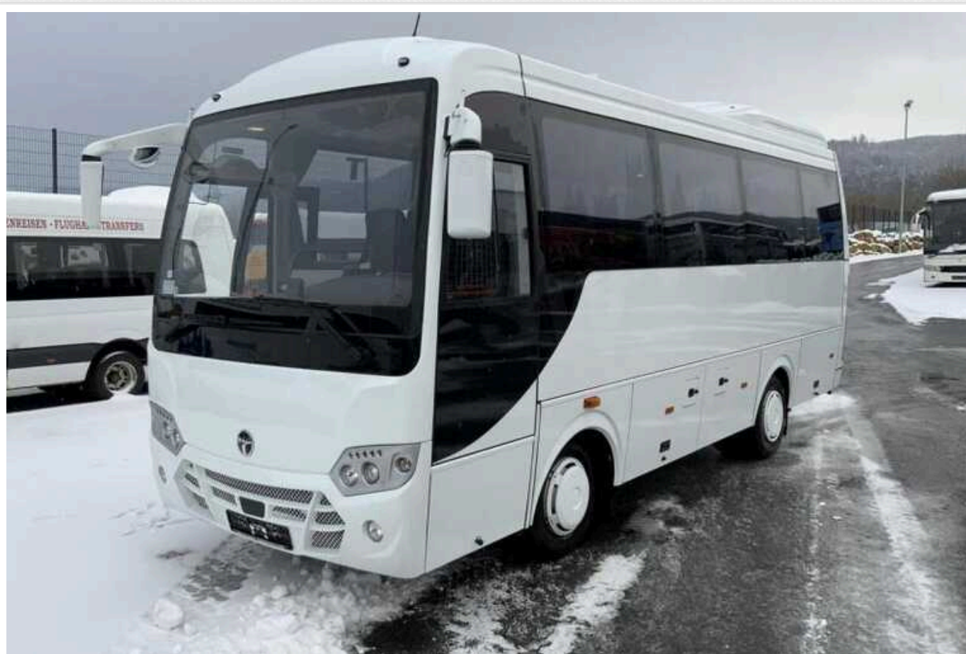
«Укрнафта» у супер-стислі строки злила 57 мільйонів на турецькі автобуси: Держаудитслужба вирішила перевірити тендер

ПАТ «Укрнафта» 21 грудня за результатами тендеру замовило ТОВ «Авто-Регіон» спеціалізованих автобусів на 57 млн грн.