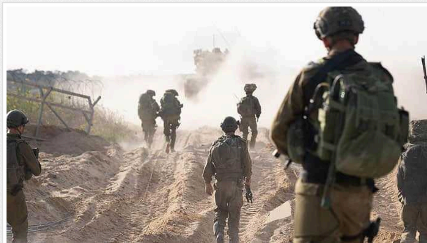
Командування ЦАХАЛ вивело одну з чотирьох дивізій із Сектору Гази

Армія оборони Ізраїлю вивела 36 дивізію з Сектору Гази з метою перегруповання та додаткових тренувань особового складу, залишивши в зоні проведення наземної операції три інші дивізії.