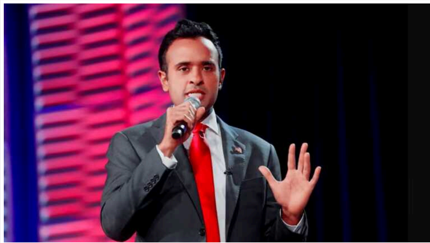
Вівек Рамасвами знявся з виборів на користь Трампа

Вівек Рамасвами, колишній керівник біотехнологічної компанії, мультимільйонер, зняв свою кандидатуру від республіканців на президентських виборах та підтримав Дональда Трампа.