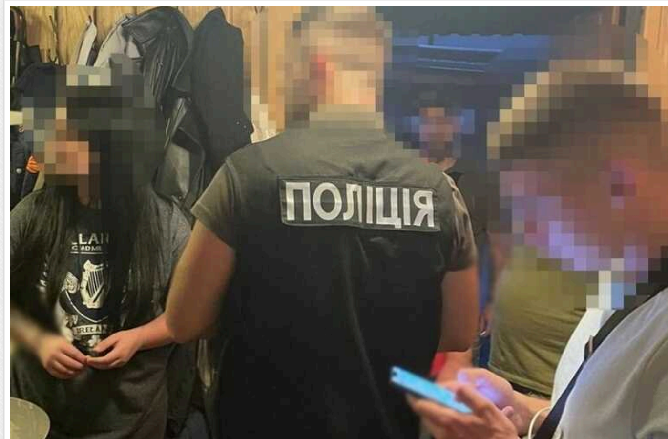
На Львівщині судитимуть шахрайку: "продала" неіснуючі товари для військових майже на 365 тисяч гривень

Прокурорами Галицької окружної прокуратури міста Львова скеровано до суду обвинувальний акт стосовно 26-річної жінки. Її обвинувачують у шахрайстві.