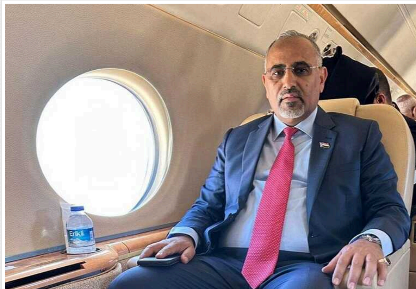
Міжнародно визнана влада Ємену закликала США та їхніх союзників посилити удари по позиціях хуситів

Ескалація з боку хуситів у Червоному морі є неприйнятною. Морське суднопластво має бути захищене – заявив віце-президент Ємену Айдарус Аз-Зубайді на форумі в Давосі.