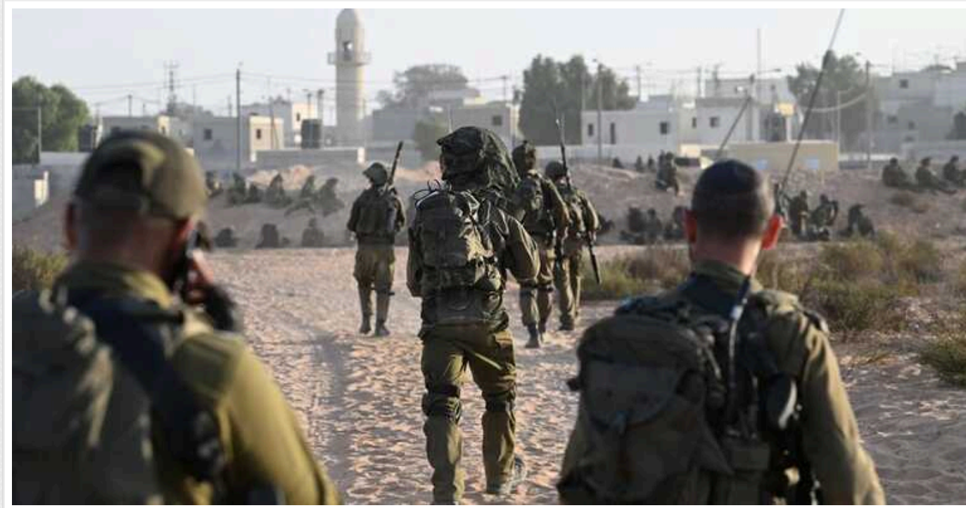
На кордоні Ізраїлю та Єгипту сталася стрілянина: є поранені з обох боків

Ввечері у понеділок, 15 січня, між озброєними людьми та ізраїльськими військовими на кордоні Ізраїлю та Єгипту сталася стрілянина.