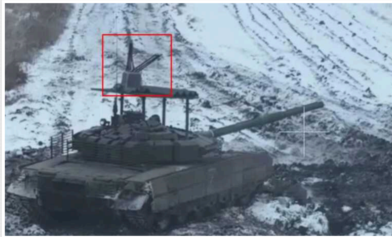
Танки ЗС РФ отримали РЕБ "Санія" проти FPV-дронів

Танки російських військових почали оснащувати комплексом «Санія», який має придушувати FPV-дрони.