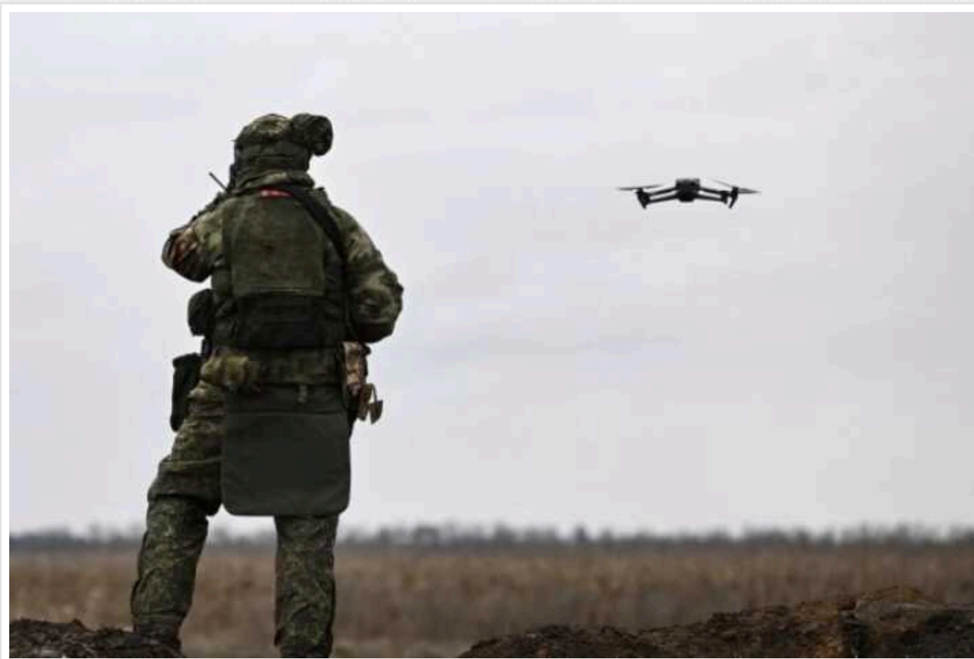
Безпілотники змусили окупантів змінити тактику, — Сирський

За словами командувача Сухопутних військ ЗСУ, у відповідь на наступ росіян українські захисники проводять невеликі контратаки, які він схарактеризував як "активну оборону".