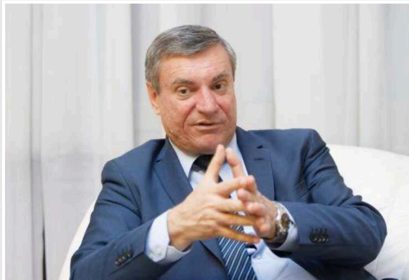
НАБУ зобов'язали відкрити справу проти колишнього віцепрем'єра України

ВАКС зобов'язав НАБУ відкрити кримінальне провадження про ймовірне вчинення колишнім віце-прем'єр-міністром – міністром з питань стратегічних галузей промисловості корупційного злочину.