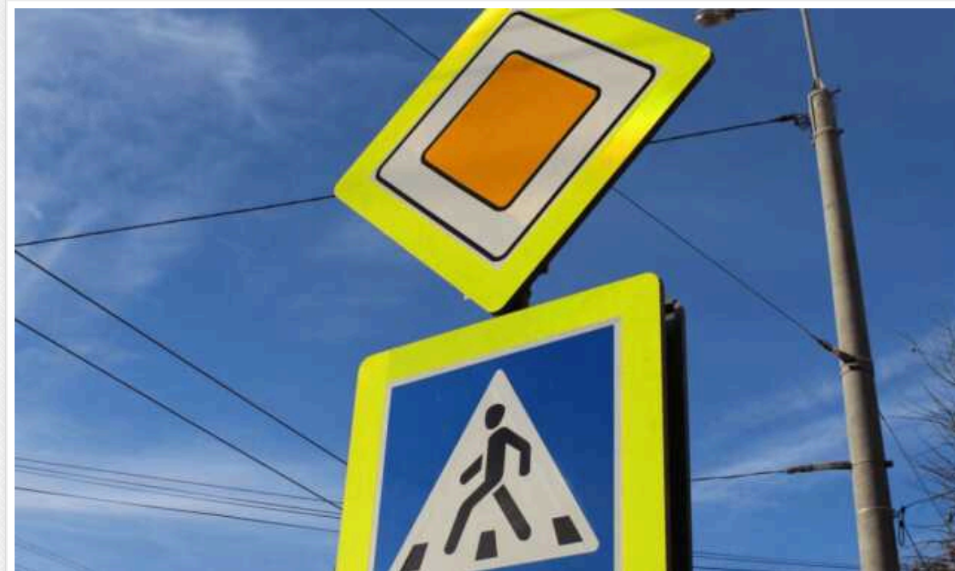
"Київпастрас" витратить 4,6 мільйона гривень на дорожні знаки

КП "Київпастрас" оголосило тендер. Понад 4 мільйони гривень сплатять підряднику, який займеться встановленням дорожніх знаків. Всього треба встановити 3000 штук.