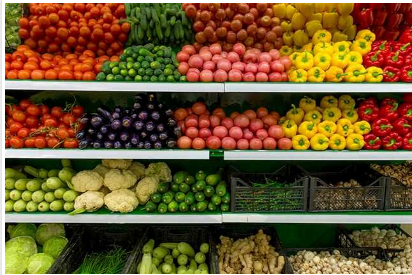
Управління освіти на Оболоні замовило овочі та ягоди на 6 мільйонів гривень: ціни дорожчі ринку

Управління освіти Оболонської РДА 28 грудня за результатами тендеру замовило ТОВ «Інтегра Торг» овочі та ягоди за 6,13 млн грн.