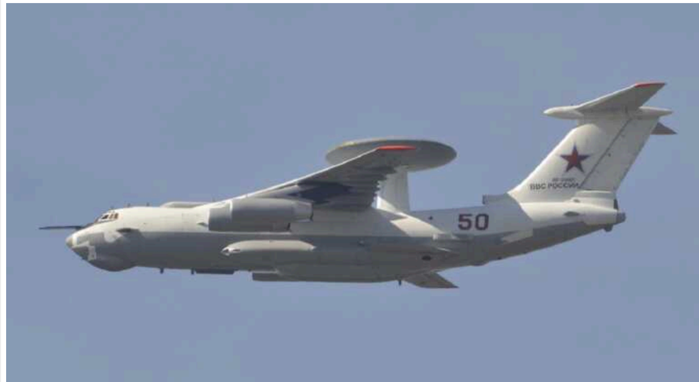
Є три варіанти, чим українська ППО збила літаки РФ вартістю понад 500 мільйонів доларів

Сили оборони України збили розвідувальний літак А-50 ЗС РФ та серйозно пошкодили повітряний командний пункт Іл-22М. Чим могли бути збиті ці літаки і як ці чудові події зможуть вплинути на розвиток бойових дій - розповів військовий аналітик, полковник ЗСУ Петро Черник.