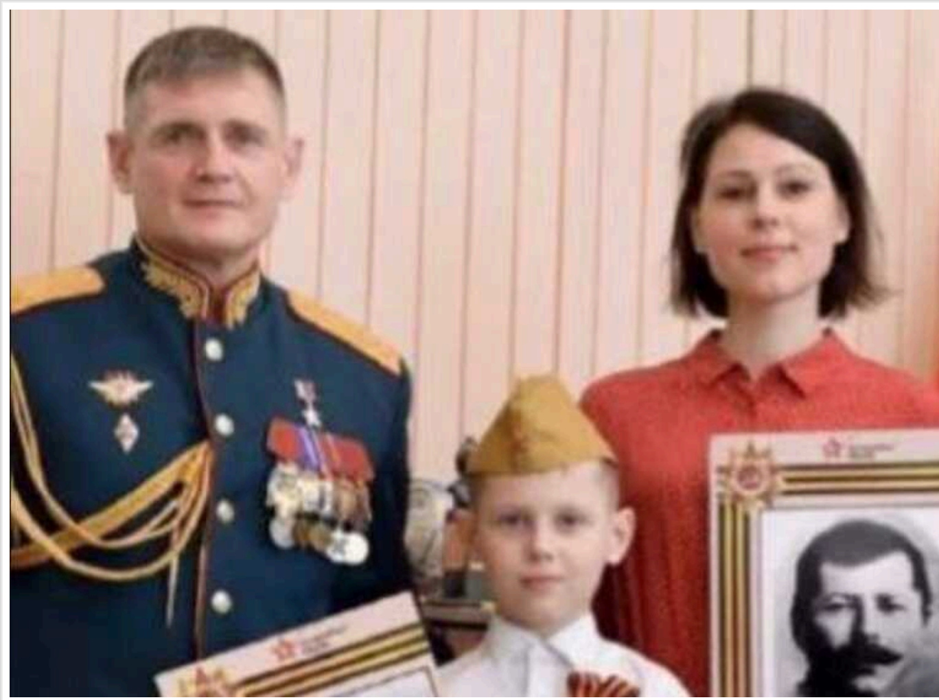
Російські пропагандисти поскаржилися на "лістівки ЗСУ" і влипли у скандал

Прокремлівські пропагандисти поскаржилися на листівки, які ЗСУ нібито розкинули над позиціями окупантів, де зображено оголену жінку із закликом до росіян повертатися додому. Після цього у штабі угруповання російських військ "Дніпро" розгорівся масштабний скандал.