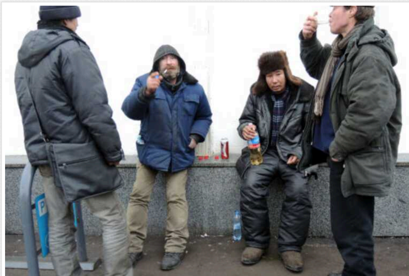
У РФ на тлі війни проти України злетіла кількість алкоголікiв

За останні два роки в Росії суттєво зростає кількість алкоголікiв. Лише 2022 року діагноз "алкогольна залежність" поставили 54,2 тисячі росіянам.