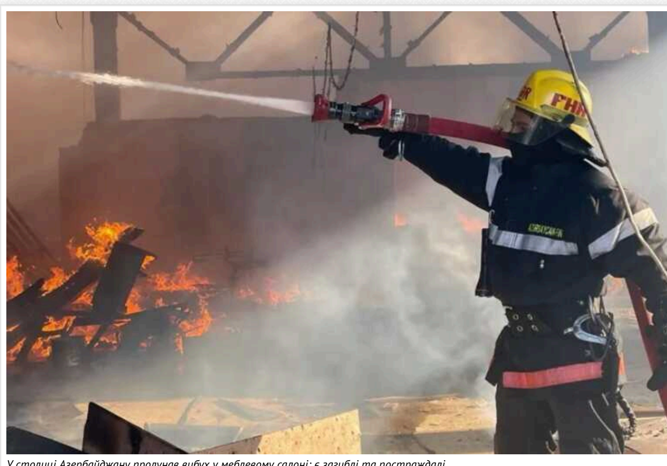
У столиці Азербайджану пролунав вибух у меблевому салоні: є загиблі та постраждали

Вдень 15 січня в Баку пролунав потужний вибух у меблевомагазині. Після цього виникла пожежа, яка призвела до загибелі трьох людей.